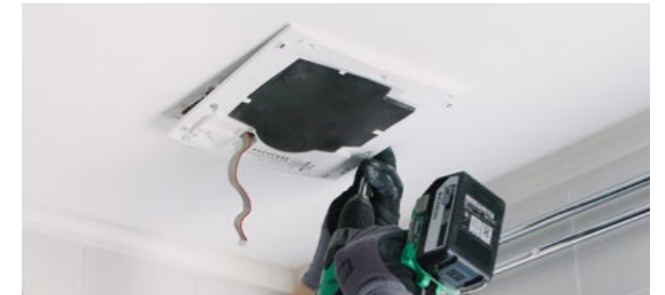
6. Träd styrkortskontakt genom fläktkåpa och skruva dit