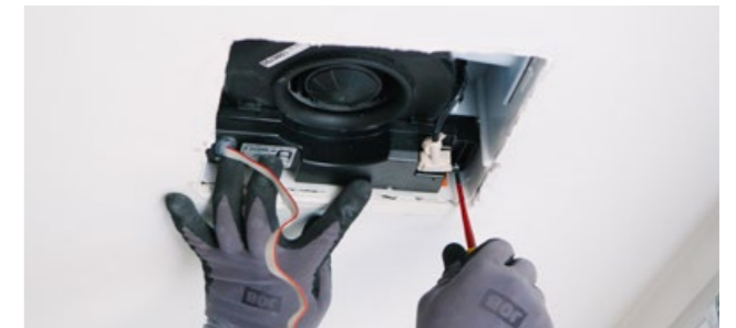
4. skruva dit fläkt