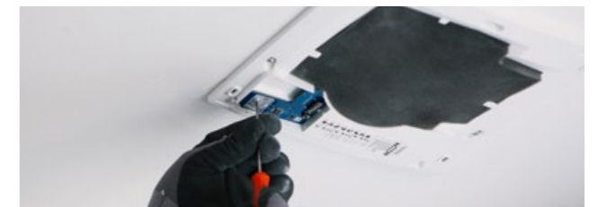
8. Skruva dit styrkort