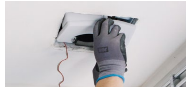
5. Montera ljudisolering