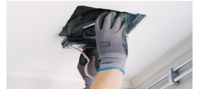
2. Tryck fläkt på plats