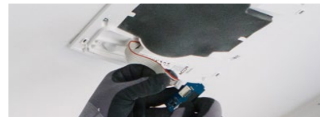
7. Koppla styrkort med kontakt