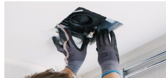
3. Säkerställ att sladd hamnar i sitt spår