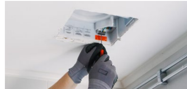
1. Koppla, nolla, fas, samt tändtråd till L1