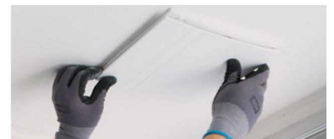
8. Montera innerkåpa